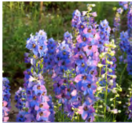
Delphinium elatum , hellblau Rittersporn

Blüthenhöhe: 100-120 cm Blütezeit: Sept-Okt