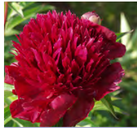
Paeonia lactiflora , rot gefüllt Pfingstrose

Blüthenhöhe: 160 cm Blütezeit: Juni-Sept, R*