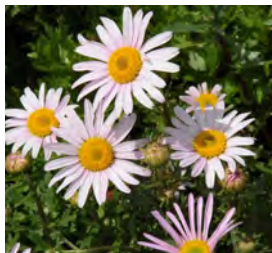
Arctanthemum arcticum 'Roseum' Margerite

Blüthenhöhe: 20-25 cm Blütezeit: Juli-Aug