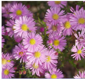
Aster pringlei 'Pink Star' Myrten-Aster

Blüthenhöhe: 100-120 cm Blütezeit: Sept-Okt