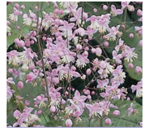
Thalictrum delavayi Wiesenraute

Blüthenhöhe: 80-100 cm Blütezeit: Juli-Sept, R*