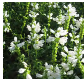
Physostegia virginiana 'Alba' Gelenkblume

Blüthenhöhe: 25-30 cm Blütezeit: Mai-Juni