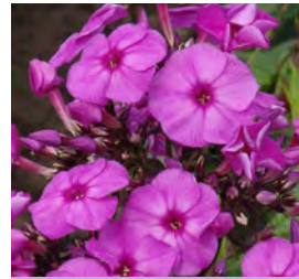
Phlox paniculata , purpur Flammenblume

Blüthenhöhe: 80-100 cm Blütezeit: Juli-Sept, R*