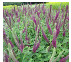
Teucrium hyrcanicum 'Paradise Delight' Gamander