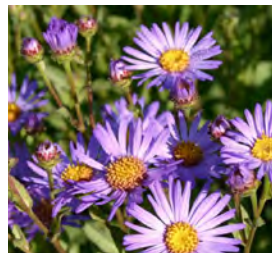
Aster amellus , blau Myrten-Aster