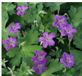
Geranium wlassovianum Storachschnabel

Blüthenhöhe: 40-60 cm Blütezeit: Juli-Aug