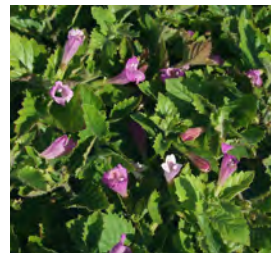
Calamintha grandiflora Bergminze

Blüthenhöhe: 50 cm Blütezeit: Juni-Aug., R*