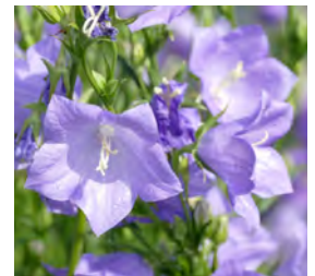
Campanula persicifolia 'Grandiflora Coerulea' Glockenblume

Blüthenhöhe: 50 cm Blütezeit: Juni-Aug., R*