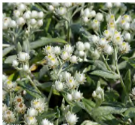
Anaphalis triplinervis Perlkörbchen

Blüthenhöhe: 120-180 cm Blütezeit: Juli-Sept