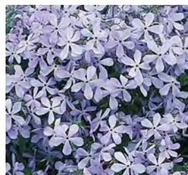
Phlox div. 'Clouds of Perfume' Wald-Flammenblume

Blüthenhöhe: 30-40 cm Blütezeit: Juli-Aug