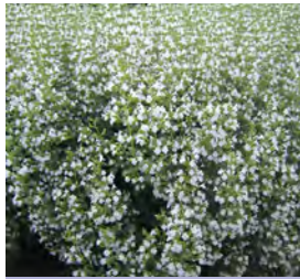
Calamintha nepeta Bergminze

Blüthenhöhe: 60-70 cm Blütezeit: Aug-Sept