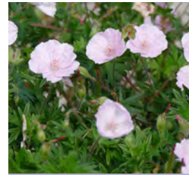
Geranium sanguineum var. striatum Storachschnabel

Blüthenhöhe: 60-100 cm Blütezeit: Juli-Sept, R*