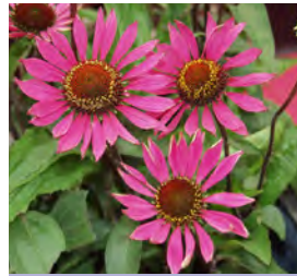
Echinacea purpurea , rot Schein-Sonnenhut

Blüthenhöhe: 30-50 cm Blütezeit: Juli-Sept, R*