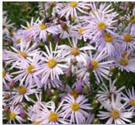
Aster pyrenaicus 'Lutetia' Pyrenäen-Aster

Blüthenhöhe: 60-70 cm Blütezeit: Aug-Sept