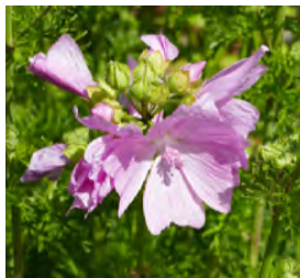
Malva moschata Moschus-Malve

Blüthenhöhe: 50-60 cm Blütezeit: Juni-Sept