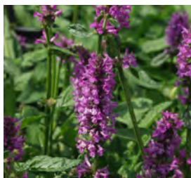
Stachys monnieri 'Hummelo' Dichtblütiger Ziest

Blüthenhöhe: 15-30 cm Blütezeit: Juli-Aug