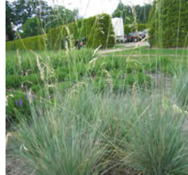
Helictotrichon sempervirens Blaustrahlhafer

Blüthenhöhe: 40-50 cm Blütezeit: Juli-Sept