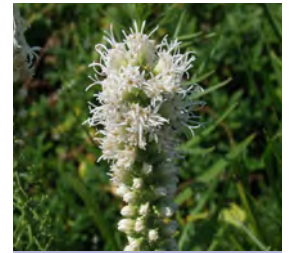
Liatris spicata 'Alba' Prachtscharte