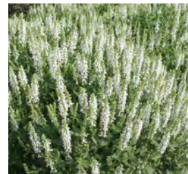
Salvia nemorosa , weiß Blüten-Salbei

Blüthenhöhe: 40-60 cm Blütezeit: Juli-Aug