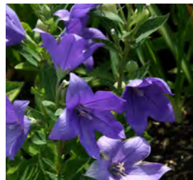
Platycodon grandiflorum 'Mariesii' Ballonblume

Blüthenhöhe: 25-30 cm Blütezeit: Juni-Sept, R*