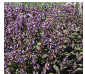
Salvia officinalis 'Purpurascens' Rotblättriger Salbei

Blüthenhöhe: 40 cm Blütezeit: Juni-Sept, R*