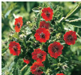
Potentilla atrosanguinea Fingerkraut

Blüthenhöhe: 20–50 cm Blütezeit: Juli–Aug