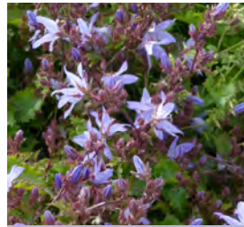
Campanula posch. 'Blauranke' Polster-Glockenblume

Blüthenhöhe: 15–20 cm Blütezeit: Juni–Sept, R*