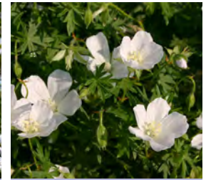
Geranium sanguineum 'Album' Storchschnabel

Blüthenhöhe: 60 cm Blütezeit: Juni–Juli, R*