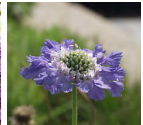
Scabiosa caucasica 'Perfecta' Skabiose

Blüthenhöhe: 50–80 cm Blütezeit: Mai–Juli, R*