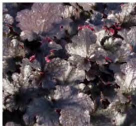
Heuchera micrantha , rotblättrig Silberglöckchen

Blüthenhöhe: 25–30 cm Blütezeit: Mai–Sept