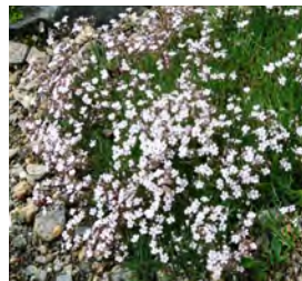
Gypsophila repens Polster-Schleierkraut

Blüthenhöhe: 15–25 cm Blütezeit: Mai–Juli