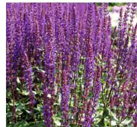
Salvia nemorosa , violett Blüten-Salbei

Blüthenhöhe: 15–25 cm Blütezeit: Mai–Juli