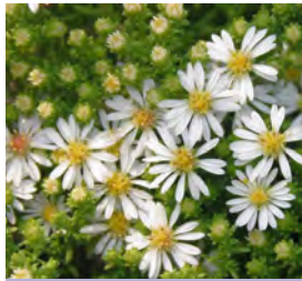
Aster ericoides var. pansus 'Snowflurry' Teppich-Aster

Blüthenhöhe: 30–40 cm Blütezeit: Juni–Juli