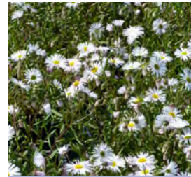
Erigeron x cult. 'Sommerneuschnee' Sommer-Aster

Blüthenhöhe: 15–20 cm Blütezeit: Juni–Sept, R*