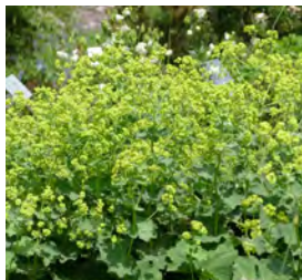
Alchemilla mollis Frauenmantel

Blütenhöhe: 60-80 cm Blütezeit: Juni-Aug