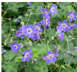
Geranium wallichianum 'Rozanne' -R- Storchnabel

Blütenhöhe: 30-40 cm Blütezeit: April-Mai