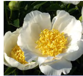
Paeonia lactiflora, weiß einfach Pfingstrose

Blütenhöhe: 60-70 cm Blütezeit: Juli-Sept