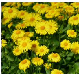
Doronicum orientale Gemswurz

Blütenhöhe: 30-40 cm Blütezeit: April-Mai