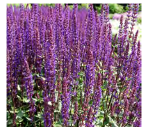
Salvia nemorosa, violett Blüten-Salbei

Blütenhöhe: 90 cm Blütezeit: Juli-Sept, R*