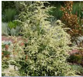
Artemisia lactiflora 'Elfenbein' China-Beifuß

Blütenhöhe: 100-150 cm Blütezeit: Sept-Okt