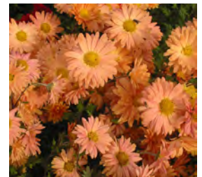
Chrysanthemum x hort., orange Herbst-Chrysantheme