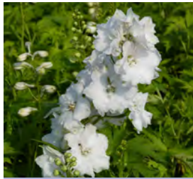
Delphinium Hybr., weiß Rittersporn

Blütenhöhe: 100-150 cm Blütezeit: Sept-Okt