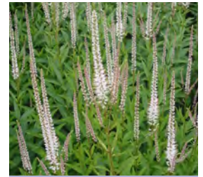
Veronicastrum virginicum 'Diana' Kandelaberehrenpreis

Blütenhöhe: 100 cm Blütezeit: Juli-Sept, R*