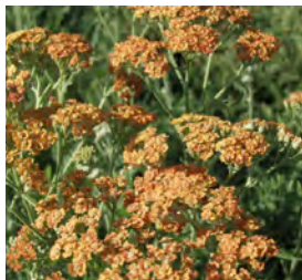
Achillea millefolium 'Terracotta' Schafgarbe

Blütenhöhe: 100 cm Blütezeit: Juli-Sept, R*