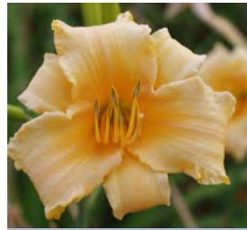
Hemerocallis x cult., orange Tagilie

Blütenhöhe: 60-70 cm Blütezeit: Juli-Sept