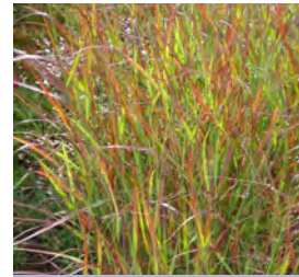
Panicum virgatum 'Rehbraun' Ruten-Hirse

Blüthenhöhe: 100 cm Blütezeit: Juli-Sept