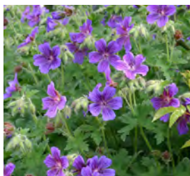
Geranium magnificum Storchschnabel

Blüthenhöhe: 70 cm Blütezeit: Juni-Aug, R*