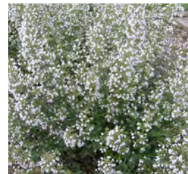
Calamintha nepeta Steinquendel

Blüthenhöhe: 30-50 cm Blütezeit: Juli-Sept