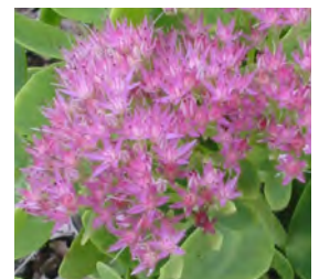
Sedum spectabile Prächtiges Fettblatt

Blüthenhöhe: 60 cm Blütezeit: Juni-Sept, R*