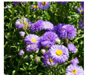
Erigeron x Hybride , blau Feinstrahlaster

Blüthenhöhe: 30-50 cm Blütezeit: Juli-Sept