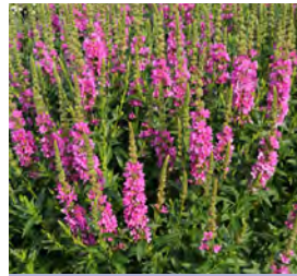
Lythrum salicaria Blutweiderich

Blüthenhöhe: 60-100 cm Blütezeit: Juli-Sept