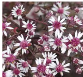
Aster laterifolius var. hori. 'Lady in Black' Waagerechte Aster