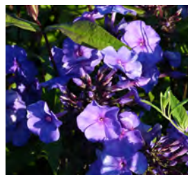
Phlox paniculata , violettblau Flammenblume

Blüthenhöhe: 60-90 cm Blütezeit: Juni-Sept