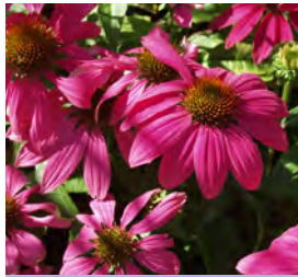
Echinacea purpurea , rot Scheinsonnenhut

Blüthenhöhe: 60-100 cm Blütezeit: Juli-Sept