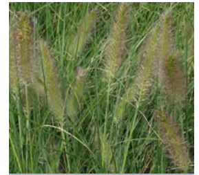
Pennisetum alopecuroides 'Hameln' Lampenputzergras

Blüthenhöhe: 100 cm Blütezeit: Juli-Sept