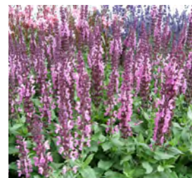
Salvia nemorosa 'Rosenwein' Blüten-Salbei

Blüthenhöhe: 80-100 cm Blütezeit: Juli-Sept