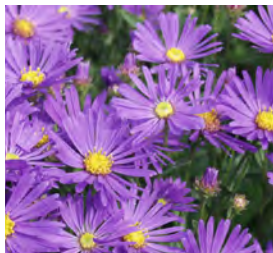
Aster amellus Berg-Aster

Blüthenhöhe: 40-50 cm Blütezeit: Aug-Sept