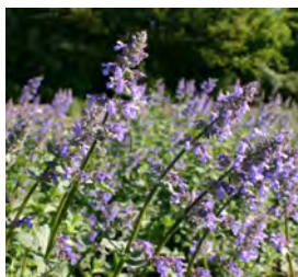
Nepeta grandiflora 'Bramdean' Katzenminze

Blüthenhöhe: 40-60 cm Blütezeit: Juni-Juli