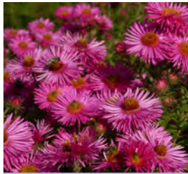
Aster novae-angliae , pink Rauhblatt-Aster