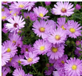
Aster dumosus , rosarot Kissen-Aster

Blüthenhöhe: 40-50 cm Blütezeit: Aug-Sept