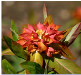
Euphorbia griffithii 'Fireglow'

Blüthenhöhe: 80-100 cm Blütezeit: Mai-Juni