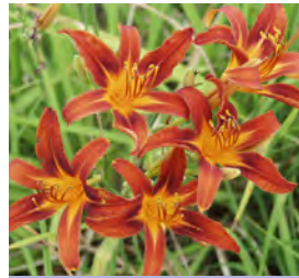
Hemerocallis x cult., rot Tagilie

Blüthenhöhe: 60-80 cm Blütezeit: Mai-Juni