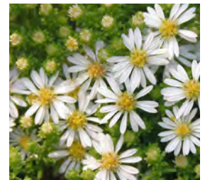
Aster ericoides var. pansus 'Snowflurry'

Blüthenhöhe: 40-60 cm Blütezeit: Juli-Okt