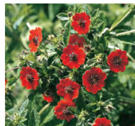
Potentilla atrosanguinea Fingerkraut

Blüthenhöhe: 50-70 cm Blütezeit: Juni-Aug, R*