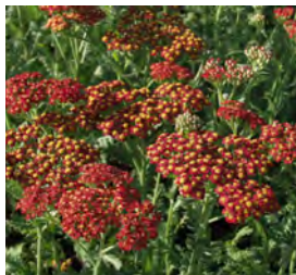
Achillea filipendulina 'Walter Funcke'

Blüthenhöhe: 100-120 cm Blütezeit: Sept-Okt