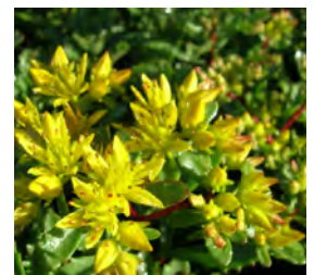
Sedum flor. 'Weihenstephaner Gold' Fettblatt