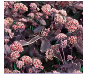
Sedum telephium, rotlaubig Hohe Fetthenne

Blüthenhöhe: 30-50 cm Blütezeit: Aug-Sept